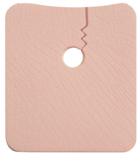
REF 958 (groß)